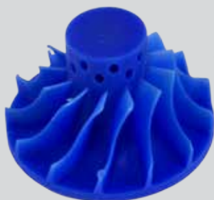
VisiJet M3 Hi-Cast