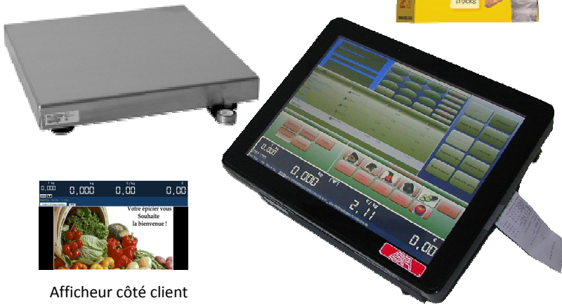
Afficheur côté client