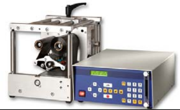
Module gauche. Module droit existant.